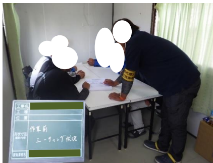
作業前ミーティング状況